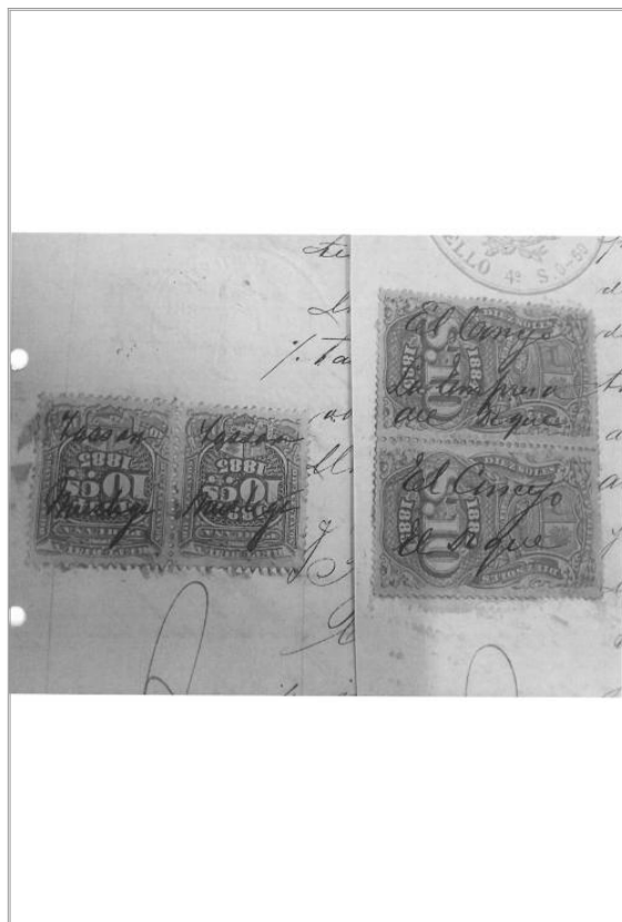
Imágen: Vista 2