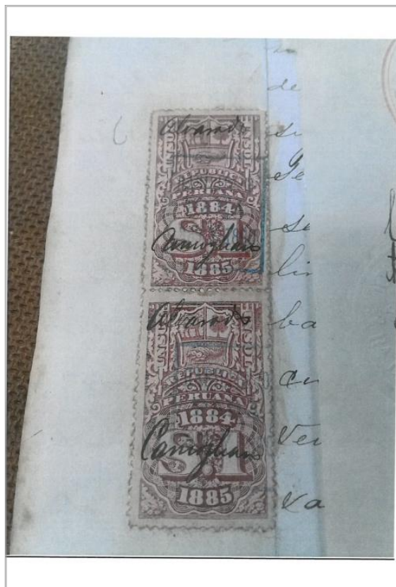
Imágen: Vista 2