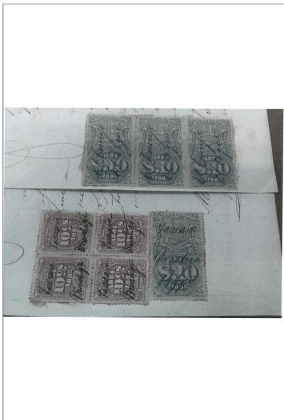
Imágen: Vista 1