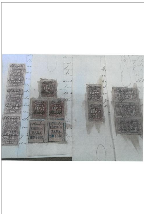
Imágen: Vista 1