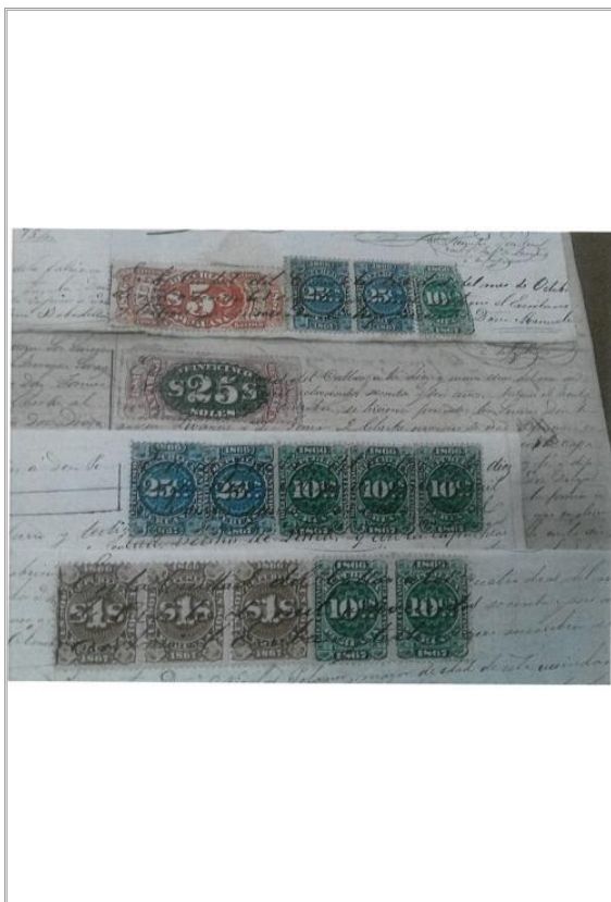
Imágen: Vista General