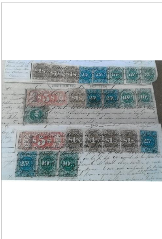
Imagen: Vista General