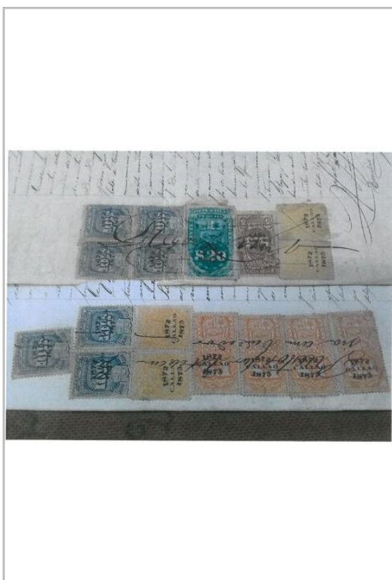
Imagen: Vista General