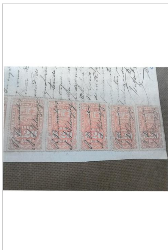
Imágen: Vista 2